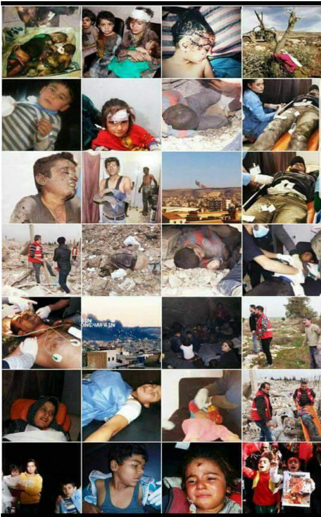
Турецкая армия также ответственна за массовое уничтожение мирных жителей деревни Хадж Халиль в районе Рахо 28-01-2018. Целями ударов